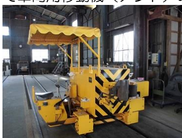
更新後の車両用移動機