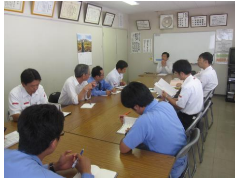
安全マネジメント会議の様様