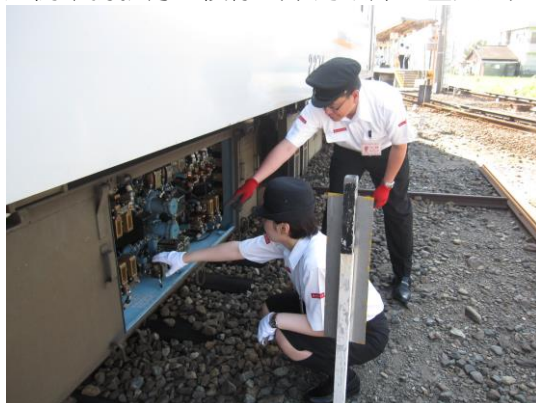
定例業務教育の様様（車両故障処置実習）