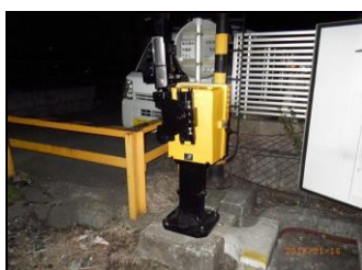
踏切遮断機（更新後）