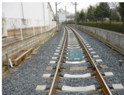
施工後（神前～竈山間）

保安度向上及び老朽化対策として、軌道材料（道床、レール、マクラギ）の更新を行いました。